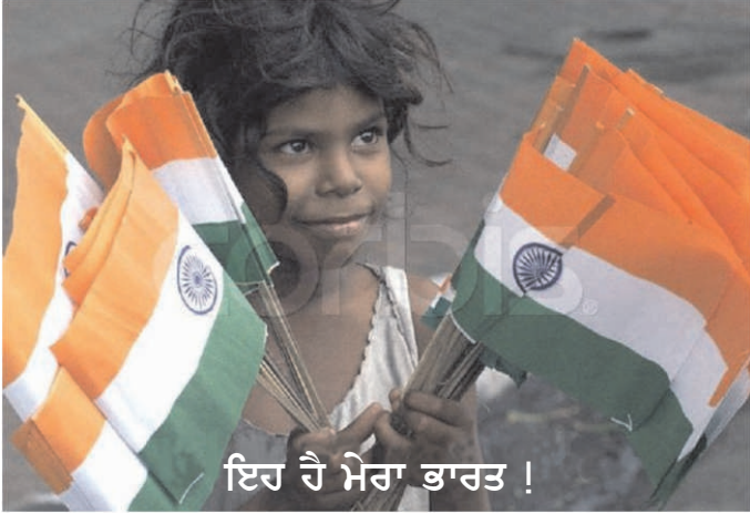
ਇਹ ਹੈ ਮੇਰਾ ਭਾਰਤ !