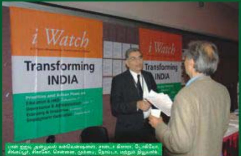
பள்ளியில் அறிவுரை வழங்கும்போது, லண்டன், டெக்ஸா, டிஸ்பர்சு, லாசாஸ், சென்னை, மும்பை, நேயா, மற்றும் திருவள்ளூர்