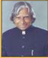
டாக்டர் ஏபிஜெ அப்துல் கலாம் முன்னர் இந்தியாவின் நடுவரைத் தலைவர்

இந்தியாவை மாற்றுவதற்கான சூயக்ள்கள் இயக்கங்கள் மூலம் ; Wash உருவாக்கப் பட்டிருப்பது அறிந்து நான் பெருமகிழ்வடைகிறேன்.