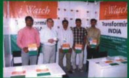
சிறு-செய்து வறுமையைக் குறைப்பதில், சென்னை, இந்தியா