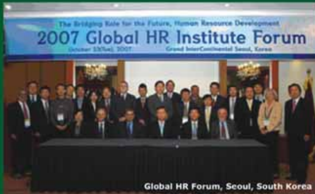
Global HR Forum, Seoul, South Korea