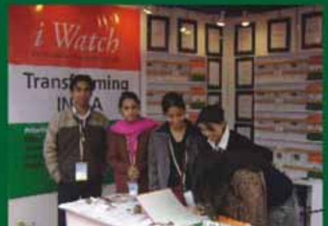
Pravasi Bhartiya Divas, New Delhi, India