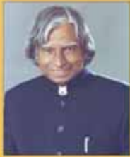
ਡਾ. ਏ.ਪੀ.ਜੇ. ਅਬਦੁਲ ਕਲਾਮ ਭਾਰਤ ਦੇ ਸਾਬਿਕਾ ਰਾਸ਼ਟਰਪਤੀ

ਮੈਨੂੰ ਇਹ ਜਾਣ ਕੇ ਬੇਹੱਦ ਖੁਸ਼ੀ ਹੋਈ ਹੈ ਕਿ 'ਭਾਰਤ ਦੀ ਕਾਇਆਕਲਪ' ਦਾ ਸੁਭ ਕਾਰਜ ਕਰਨ ਲਈ ਨਾਗਰਿਕ ਅੰਦੋਲਨ ਦੁਆਰਾ "i Watch" ਨੇ ਬੀੜਾ ਉਠਾਇਆ ਹੈ।