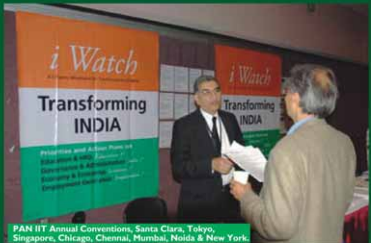
PAN IIT Annual Conventions, Santa Clara, Tokyo, Singapore, Chicago, Chennai, Mumbai, Noida & New York.