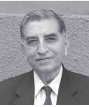
କୃଷ୍ଣ ଖାନା ଫାଉଣ୍ଡର ଆଣ୍ଡ ଟ୍ରଷ୍ଟି i Watch