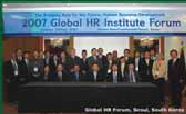
Global HR Forum, Seoul, South Korea