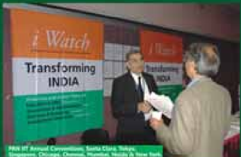
HRD Annual Convention, Juhu Club, New Delhi, India Singapore, Chennai, Mumbai, Kolkata & New York