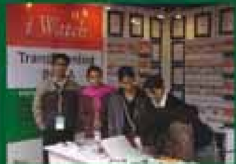
Pravasi Bhartiya Samvaad, New Delhi, India