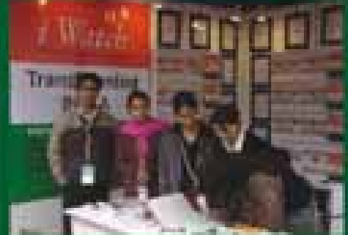
Panel Discussion, New Delhi, India