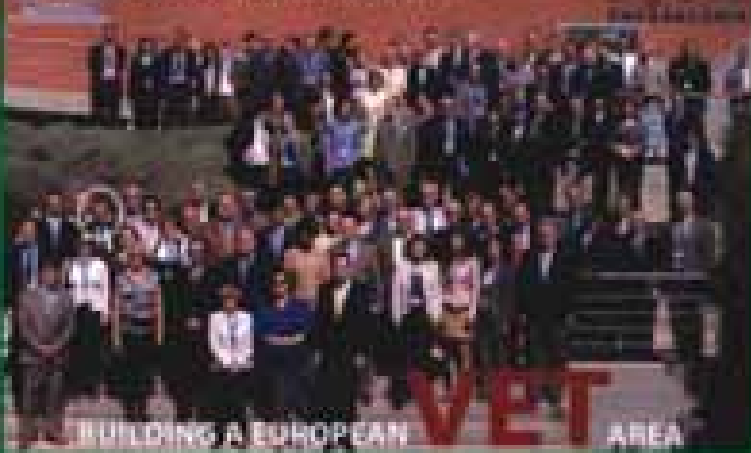
EU Annual Board talks, Thessaloniki, Greece