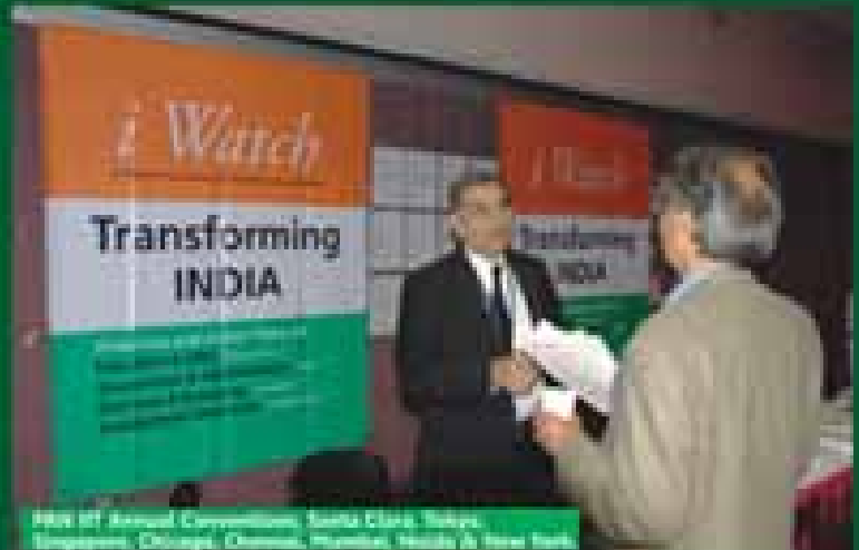
HRD Annual Convention, Juhu Club, New Delhi, Chennai, Mumbai, Varanasi & New York