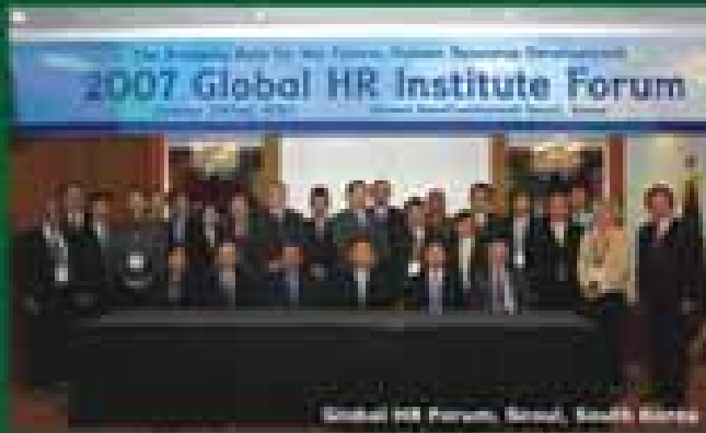
Global HR Forum, Seoul, South Korea